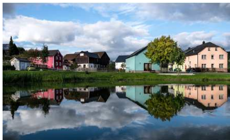
Mödlareuth et sa rivière Tannbach