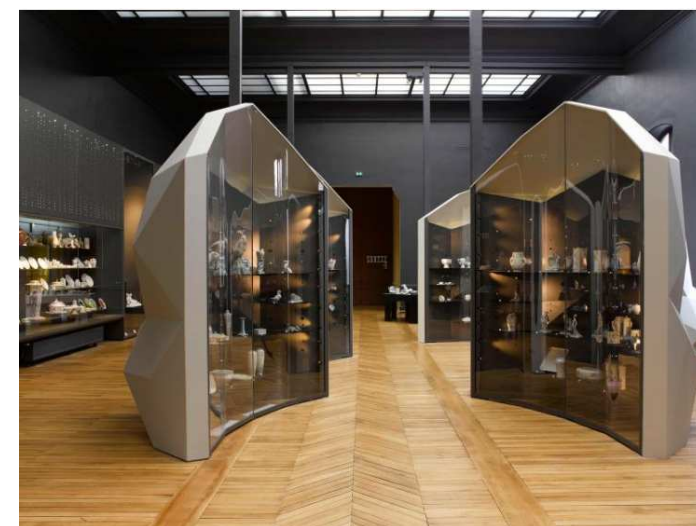
Musée de porcelaine

Départ en bus vers 7H, distance Bad Abbach / Mödlareuth: environ 200 km Retour vers 20H, soirée libre dans sa famille d'accueil